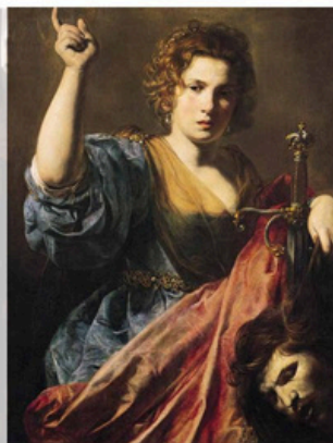
Judith, Valentin de Boulogne vers 1625